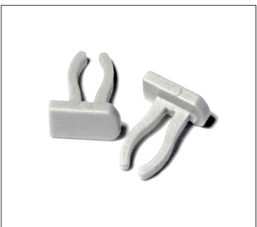
Endcaps till profil S-7

Slutligen stick ned S-7-endcapsen i glappet mellan sidoprofilen och den övre och undre kortade raden, på båda sidor.